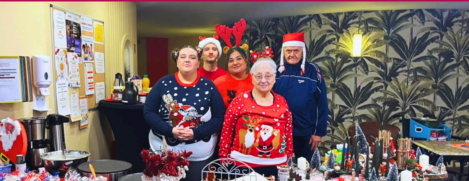
Marché de Noël de La Résidence Autonomie de Saint-Just-En-Chaussée