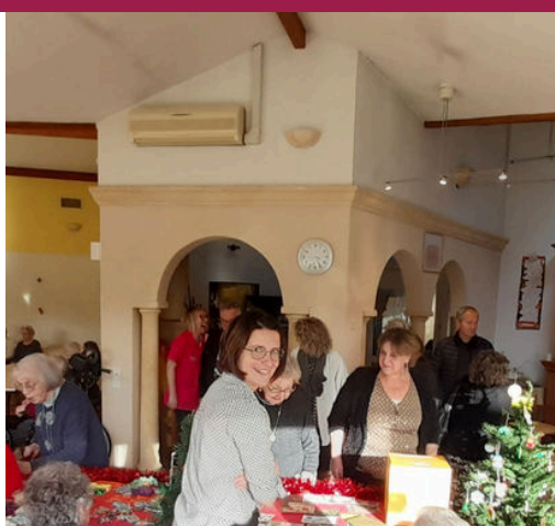
Marché de Noël au profit du Téléthon Razac-Sur-l'Isle