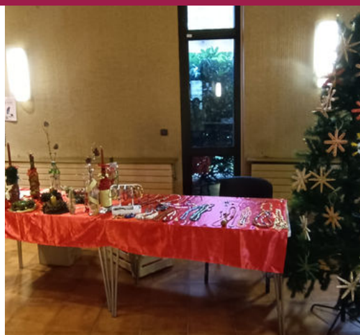
Marché de Noël à Lyon