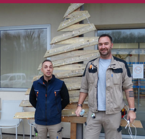
Création d'un sapin en bois par les ouvriers de Domfront

Nous sommes ravis de partager avec vous quelques souvenirs de ces moments inoubliables à travers ces photos.