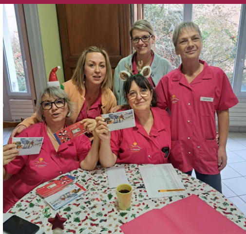
Distribution des chèques cadeaux La-Chapelle-de-Guinchay