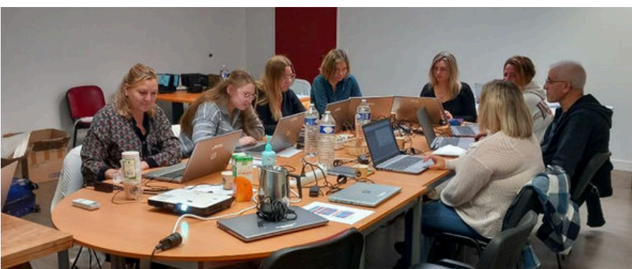
Retour en image de la formation des équipes de Razac, Toulouse et Domfront.

Développer nos actions, c'est donner à notre Association les moyens d'agir plus efficacement, d'atteindre de nouveaux publics et de créer un environnement propice à la cohésion et à la réussite collective. Ensemble, relevons les défis d'aujourd'hui tout en préparant l'avenir, car l'innovation et le développement sont les moteurs d'un secteur associatif solidaire, performant et engagé.