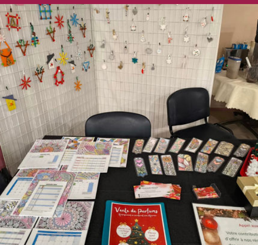
Marché de Noël Chaumont-En-Vexin