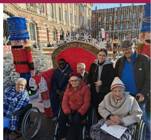
Sortie au Marché de Noël Toulouse